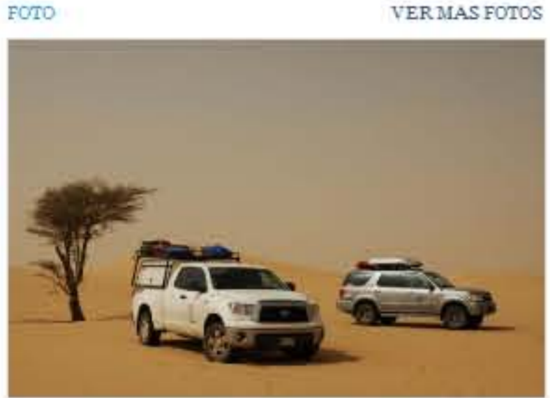
Momentos inolvidables: en el desierto del Sahara

Imprimir Enviar por e-mail Cambiar tamaño Publicar Compartir